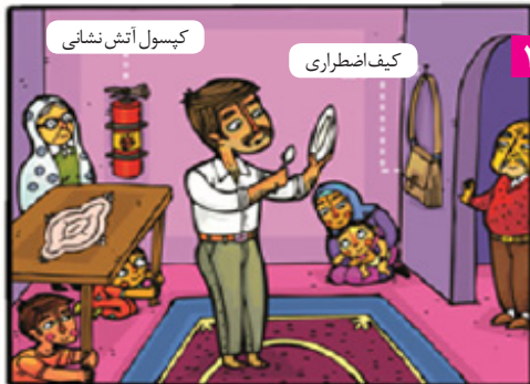
تمام اعضا خانواده سالی ۲ بار آمادگی برای مخاطرات طبیعی را تمرین می کنند (مانور خانواده).