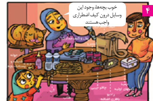
هر خانواده حداقل یک کیف اضطراری داشته و در دسترس قرار داده است. بهتر است یک کیف اضطراری نیز در صندوق عقب ماشین بگذاریم.