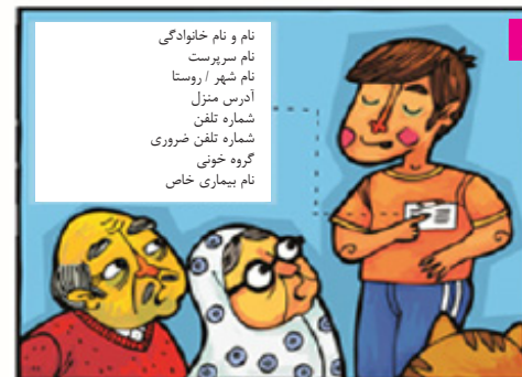
در کاغذی اطلاعات شخصی خود را بنویسید و آنرا در کیف اضطراری و جیبتان بگذارید.