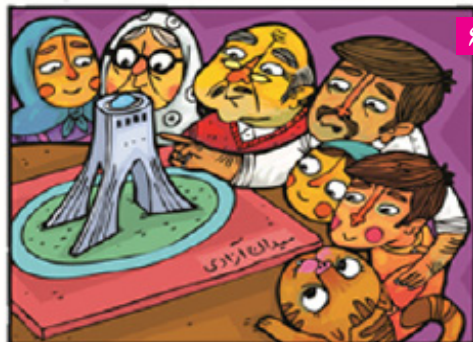
خانواده محلی را برای ملاقات بعد از حادثه تعیین می کند.