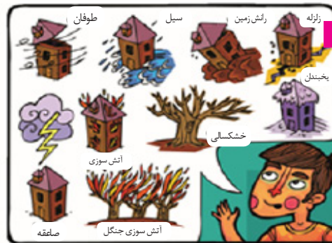
خانواده سالی ۲ بار درباره خطرات طبیعی که تهدیدش می کند، گفتگو می کند. در این گفتگو همه اعضای خانواده شرکت می کنند.